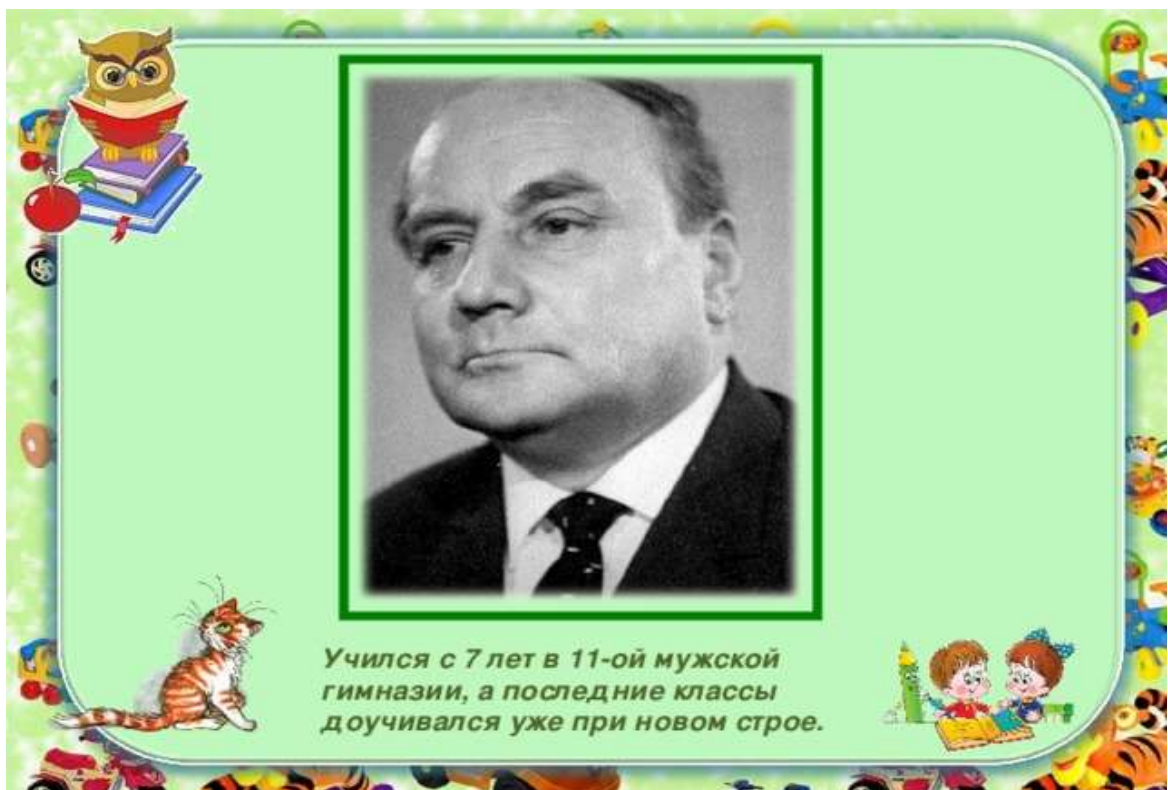
Учился с 7 лет в 11-ой мужской гимназии, а последние классы доучивался уже при новом строе.

родился 5 июля 1903 года в Москве, в семье врача